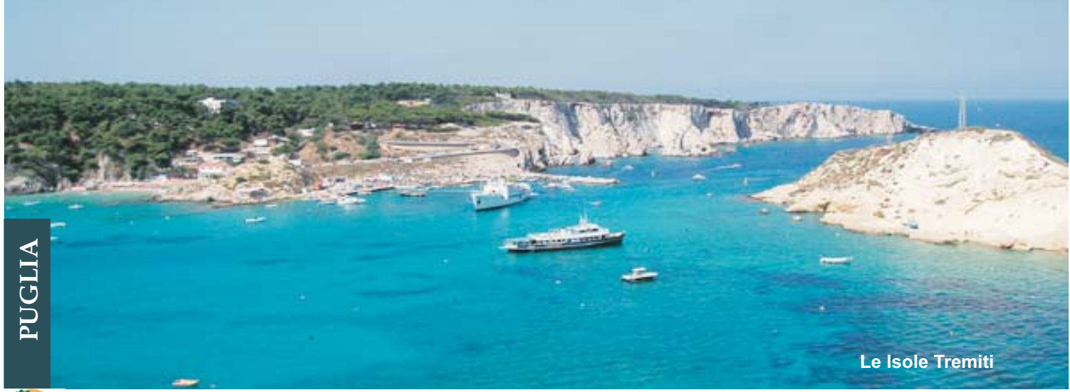
Le Isole Tremiti