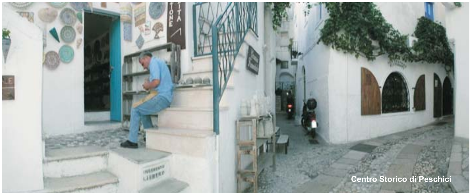
Centro Storico di Peschici