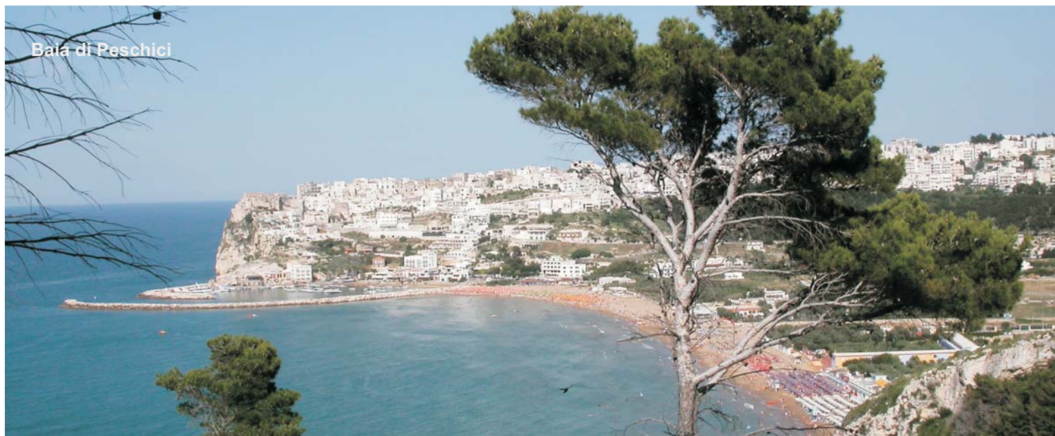
Baia di Peschici

Nostra Opinione: Il Residence è posto in ottima posizione a pochi passi dal centro città e dallo shopping, La tranquillità oltre al buon arredamento sono le sue forze. La spiaggia si raggiunge in auto o in Bus navetta, il Residence è adatto a chi desidera una vacanza tranquilla con un panorama mozzafiato.