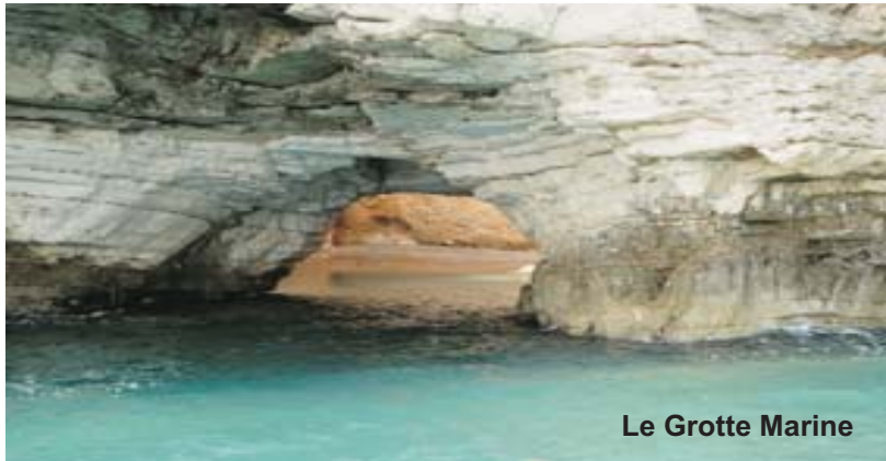
Le Grotte Marine