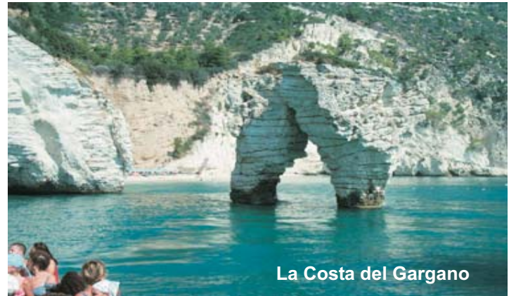
La Costa del Gargano