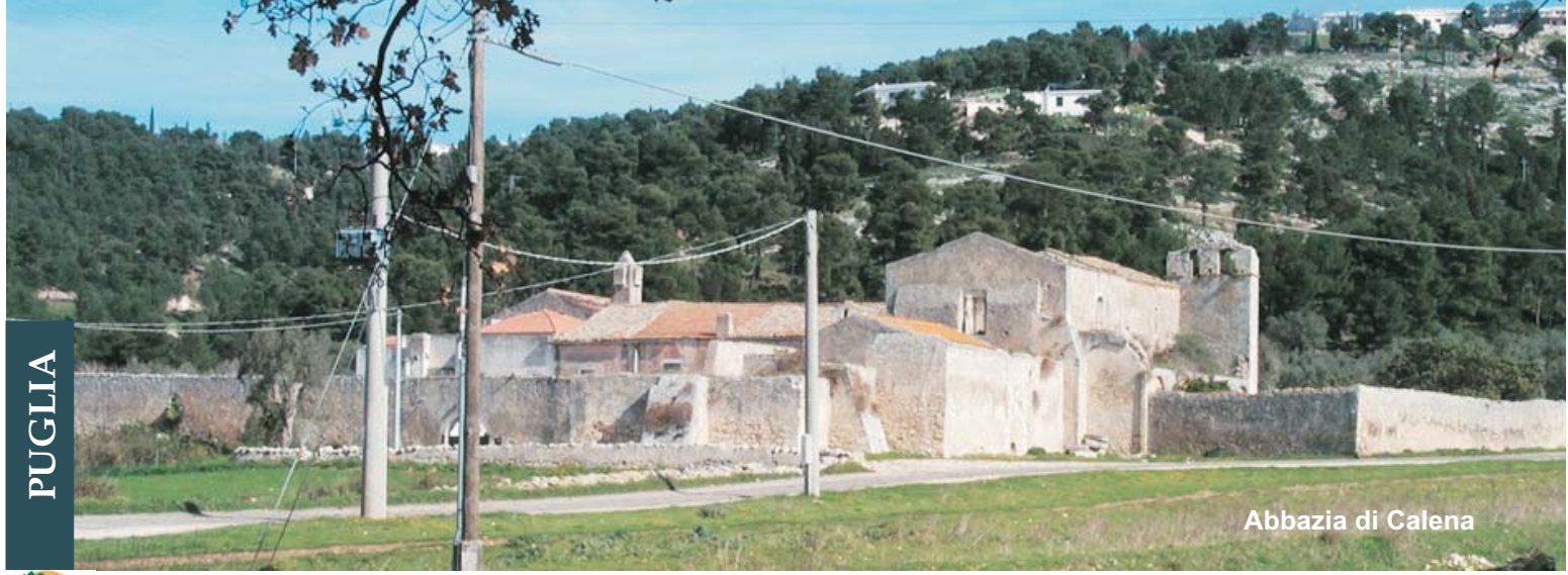
Abbazia di Calena