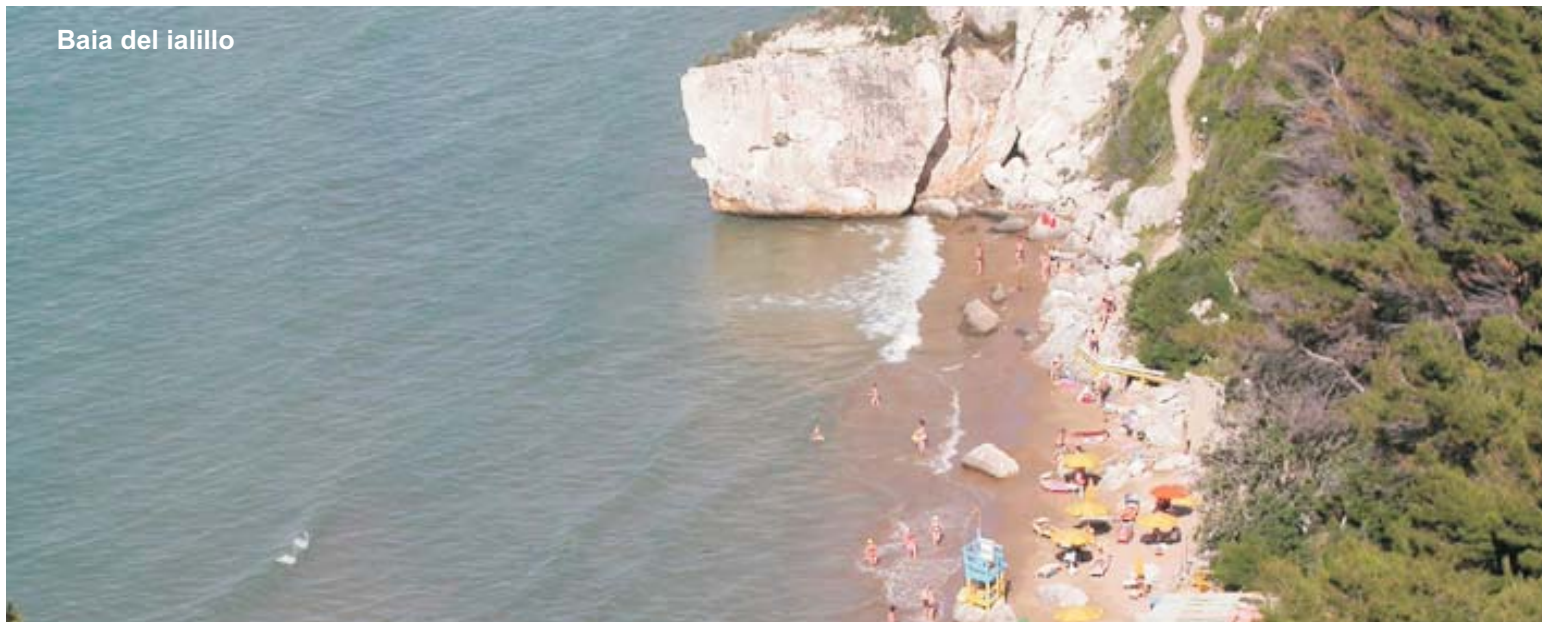
Baia del ialillo

Possibili con Assegni, Contanti, Pos, Carte di Credito : MasterCard, Visa.