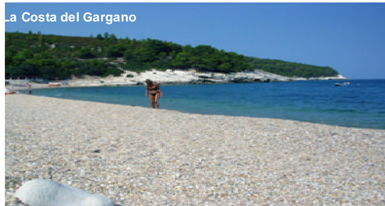
La Costa del Gargano