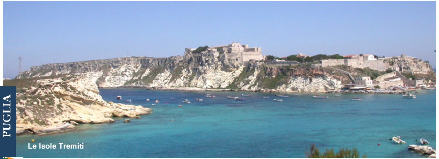
Le Isole Tremiti