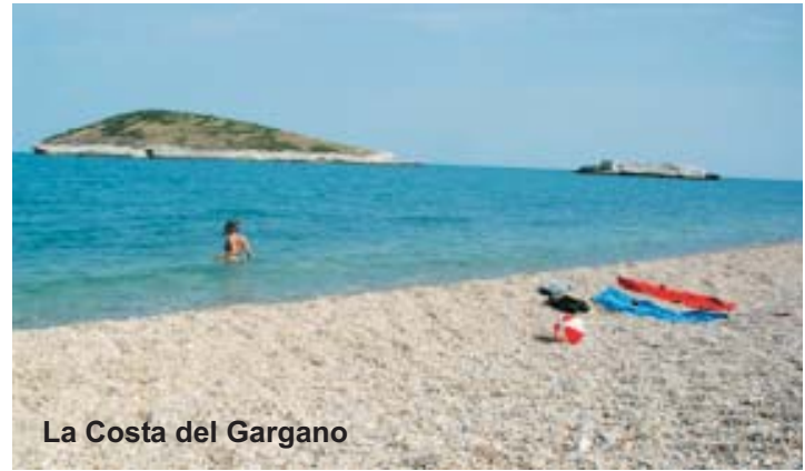
La Costa del Gargano