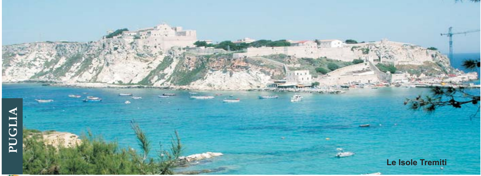
Le Isole Tremiti