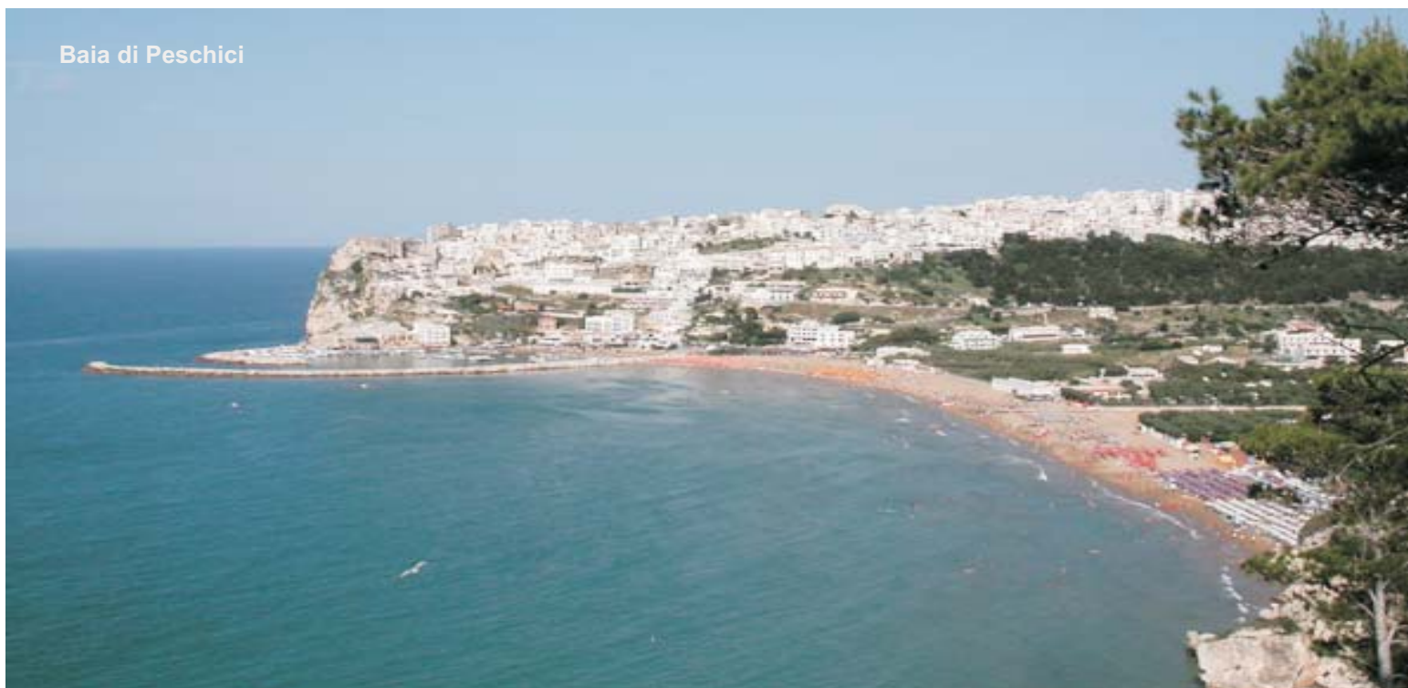
Baia di Peschici

Nostra Opinione: Il Residence è posto in ottima posizione a pochi passi dal centro città e dallo shopping, la spiaggia non è molto distante, ma comunque ben collegata con Bus navetta, il Residence è adatto a chi desidera avere tutti i servizi a disposizione in un ambiente informale.