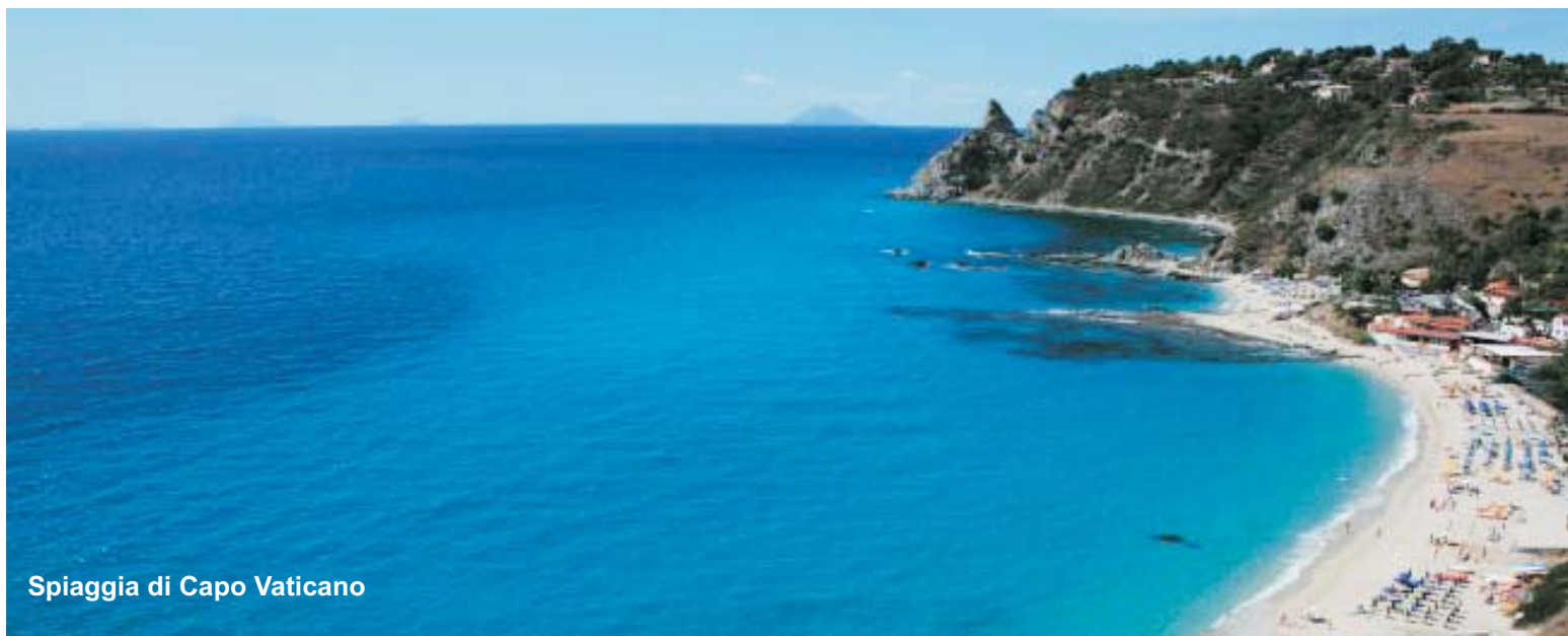
Spiaggia di Capo Vaticano