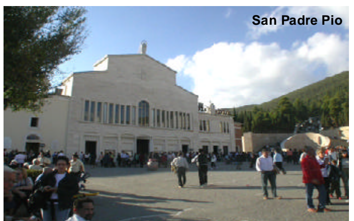
San Padre Pio