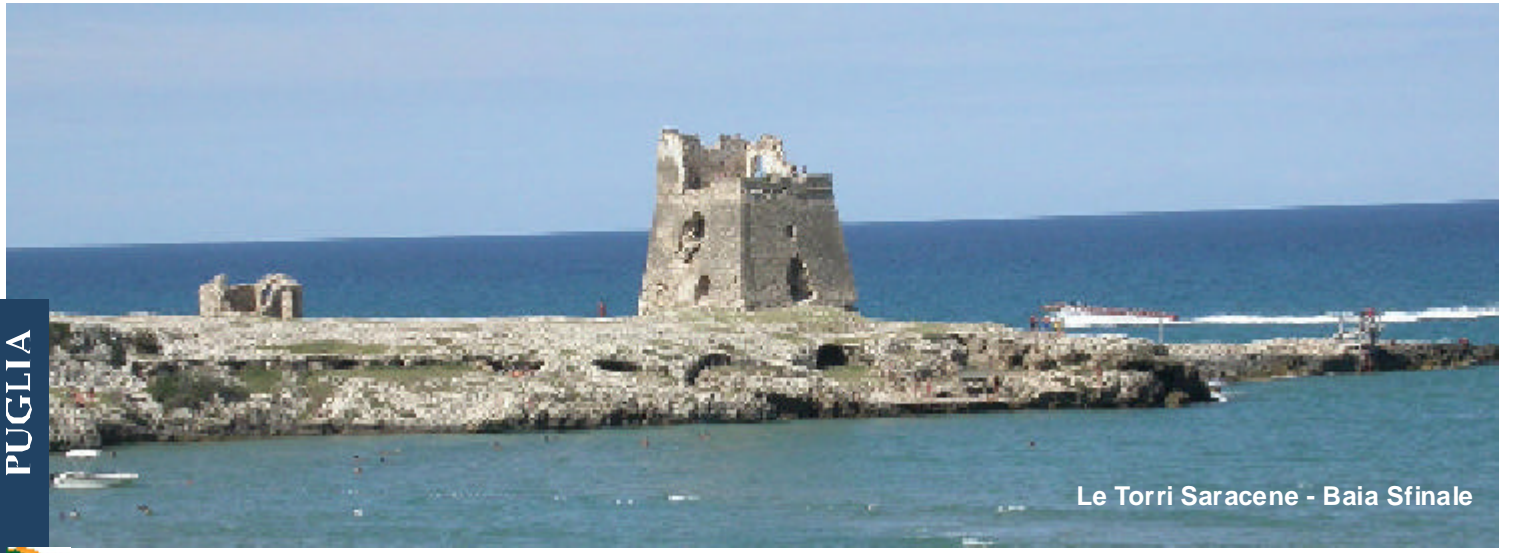
Le Torri Saracene - Baia Sfinale