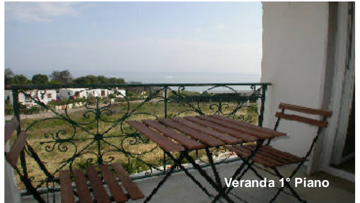
Veranda 1° Piano