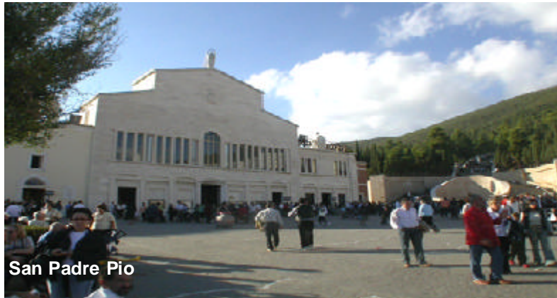
San Padre Pio