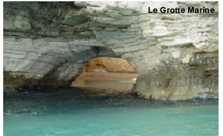
Le Grotte Marine